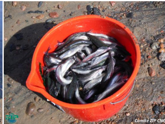
2- Prises d'un pêcheur de capelans