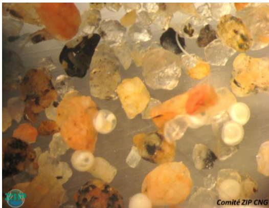
3- Œufs de capelans mélangés à des grains de sable, vus à travers une loupe binoculaire