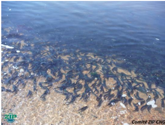
1- Capelans qui roulent